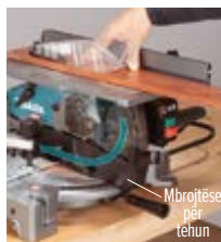
Mbrojtëse për tehun

Mundësi për rregullim të saktë të lartësisë së tavolinës Mekanizmi i levës së dhëmbëzuar mundëson rregullim të lehtë dhe të saktë të lartësisë së tavolinës, si dhe prerje të kontrolluar dhe të qëndrueshme kur punoni me materiale dhe aplikime të ndryshme.