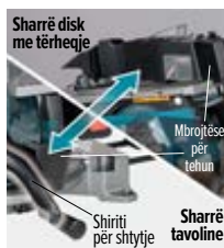
Sharrë disk me tërheqje

Efikasitet më i lartë i thithjes së pluhurit Rruga e ridizajnuar e rrjedhës së ajrit e përmirëson ndjeshëm mbledhjen e pluhurit në modalitetin e sharrës së tavolinës, duke e zvogëluar kështu emetimin e pluhurit nga mbulesa e sharrës dhe duke e rritur pastërtinë e vendit të punës.